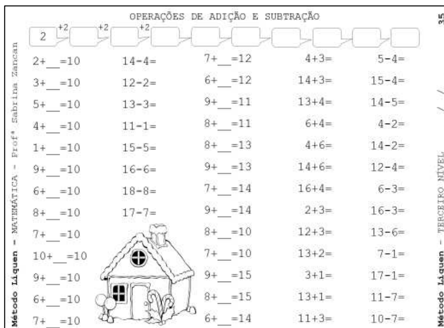
Figura 2 - Exemplo de tarefa para o terceiro ano

Na Figura 2 temos um exemplo de tarefa do terceiro ano com quatro blocos de atividades. Completar o bloco com atividades de múltiplos do 2, colocados horizontalmente acima das atividades. A primeira e a segunda colunas com blocos que constroem a rede pelo 10 . A terceira coluna com um bloco que exercita completar do menor até o maior, passando pelo 10 . E as duas últimas colunas com blocos de adição e subtração, explorando propriedades dos números.